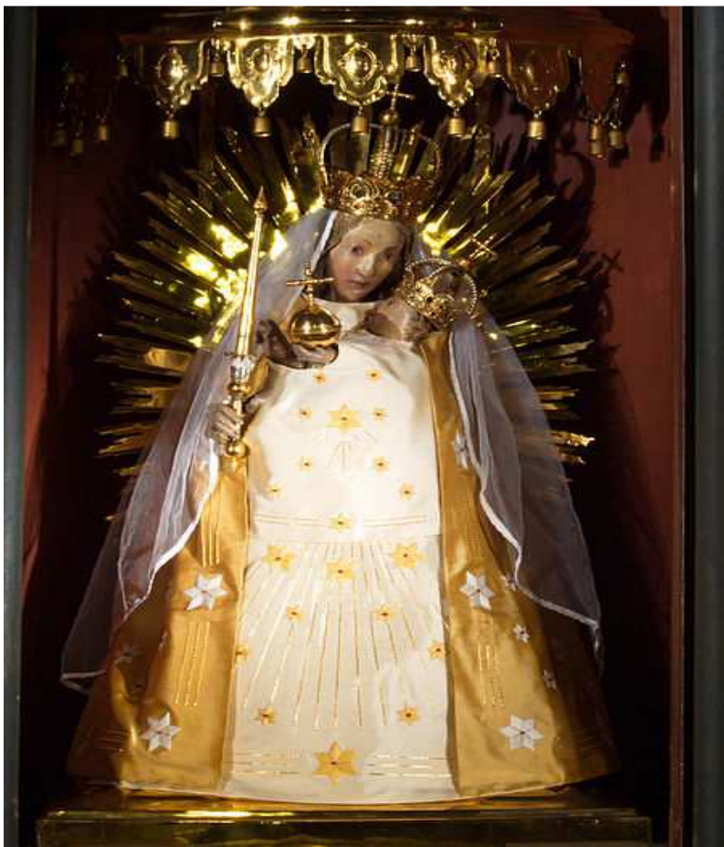
Gnadenbild von Verne